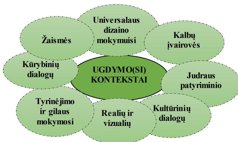
(3 pav.) Kontekstai rekomenduojami pagal Gaires

Kiekviena iš šių erdvių yra neatsiejama įstaigos ugdymo proceso dalis, kurioje vaikai ne tik žaidžia, bet ir mokosi, kuria, bendradarbiauja ir atranda save bei aplinką. Visos šios erdvės prisideda prie vaiko visapusiško vystymosi, skatindamos kūrybiškumą, bendravimą, emocinę pusiausvyrą ir tvarumą.